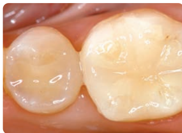
Dopo: inlay IPS Empress CAD cementati con adesivo Multilink Automix