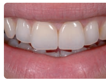
Dopo: corone IPS e.max su una preparazione vitale e abutment in ZrO 2