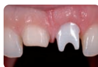
Prima: situazione preoperatoria insufficiente

Offre inoltre un'ampia scelta di metodiche di cementazione a seconda dell'indicazione: corone e ponti possono essere cementati con la tecnica adesiva, oppure con cementazione autoadesiva o convenzionale.