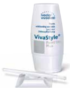
VivaStyle® Paint On Plus

I prodotti VivaStyle rendono i denti più bianchi e contribuiscono a realizzare il desiderio di un sorriso luminoso. La varietà dei prodotti VivaStyle consente di rispondere in modo mirato alle diverse esigenze individuali, con soluzioni di trattamento in studio o domiciliare.