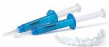
VivaStyle® 30% VivaStyle® 10% | 16%